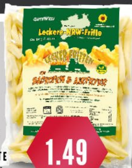
Lecker Fritten LECKERE- NRW-FRITTE versch. Sorten, 600-750 g Beutel 1 kg = ab 1,99 €