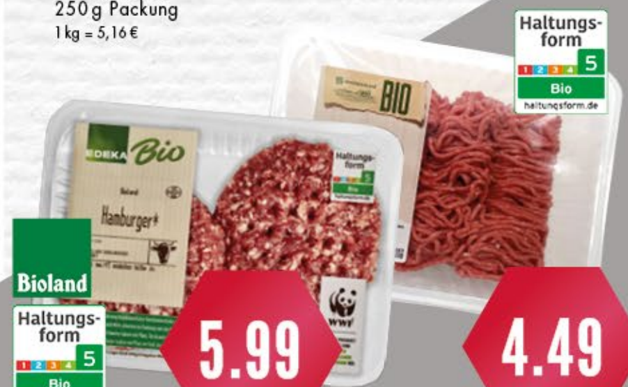
EDEKA BIO BIO HAMBURGER vom Rind, 2 x 125 g = 250 g Packung, 1 kg = 23,96 €