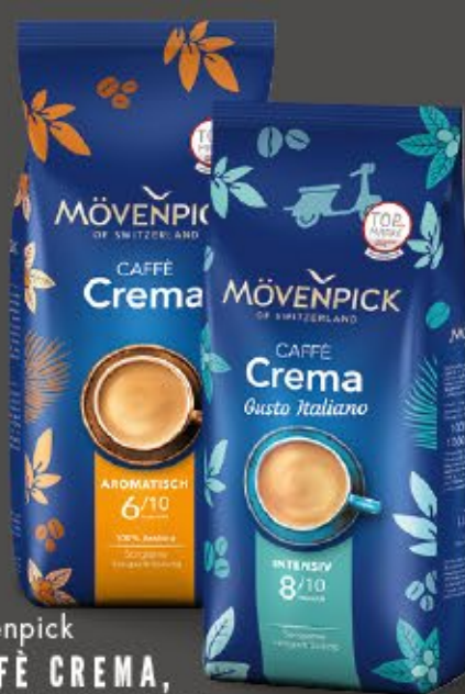
Mövenpick CAFFÈ CREMA, GUSTO ITALIANO O. SCHÜMLI ganze Bohnen, 1 kg Beutel