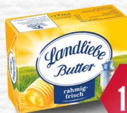
Landliebe BUTTER O. DIE STREICHARTE 75-82 % Fett, 250 g Packung 1 kg = 5,16 €