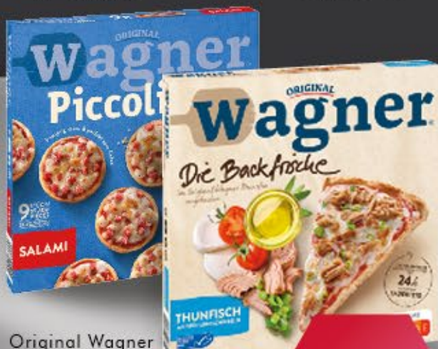
Original Wagner DIE BACKFRISCHE, PICCOLINIS O. BIG CITY PIZZA versch. Sorten, 243-445 g Packung, 1 kg = ab 4,99 €