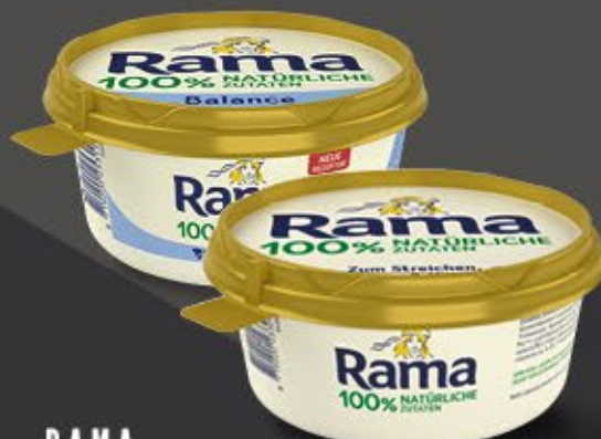
RAMA „Original“ o. „Balance“, 39-60 % Fett, 400-450 g Becher 1 kg = ab 2,87 €