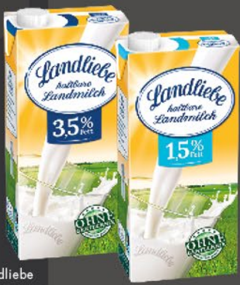
Landliebe HALTBARE LANDMILCH 1,5-3,5 % Fett, 1 l Packung