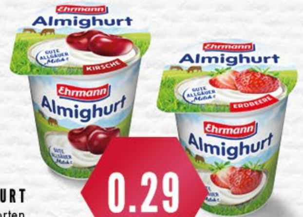
Ehrmann ALMIGHURT versch. Sorten, 140-150 g Becher 1 kg = ab 1,93 €