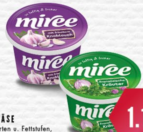
miree FRISCHKÄSE versch. Sorten u. Fettstufen, 135-150 g Becher 1 kg = ab 7,40 €