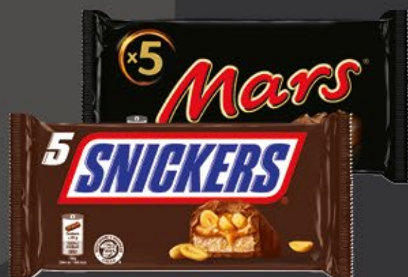
SNICKERS O. MARS 5 Stück = 225-250 g Packung 1 kg = ab 7,96 €