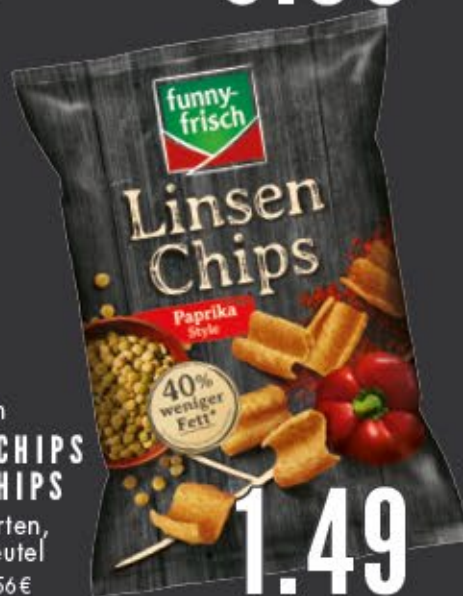
funny-frisch LINSEN CHIPS O. POPCHIPS versch. Sorten, 80-90 g Beutel 1 kg = ab 16,56 €