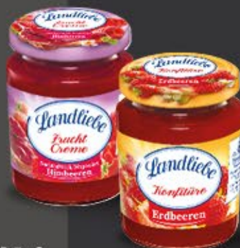
Landliebe KONFITÜRE O. FRUCHTCREME versch. Sorten, 200 g Glas 1 kg = 7,45 €