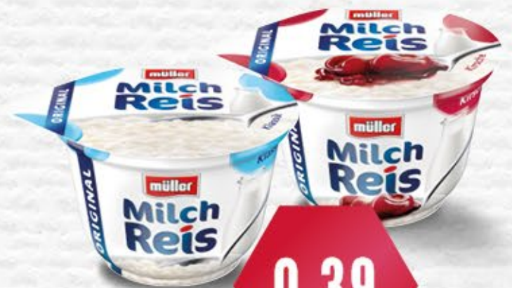
müller MILCHREIS versch. Sorten, 180-200 g Becher 1 kg = ab 1,95 €