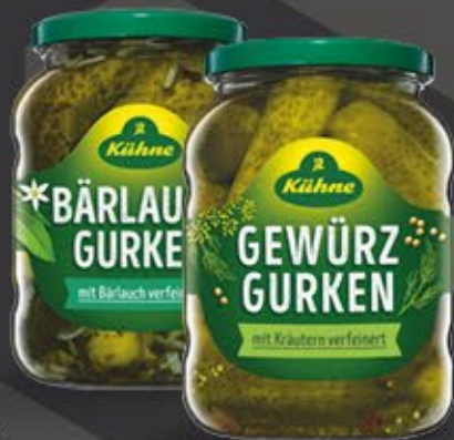
Kühne GURKEN versch. Sorten, 650-670 g / 360-370 g Glas 1 kg = ab 4,84 €