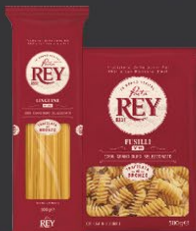
PASTA REY versch. Sorten, 500 g Packung 1 kg = 1,98 €